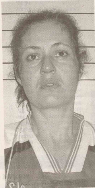
Gaúcha: dificuldades financeiras

Gaúcha admitiu que vendia drogas por causa de dificuldades financeiras. Autuada em flagrante por tráfico, ela foi encaminhada à cadeia feminina anexa ao 2º DP de Santos.