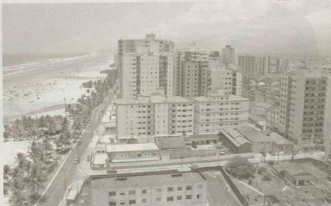
ADALBERTO MARQUES 15/1/08

Bueno esteve em Praia Grande na terça-feira para partici-