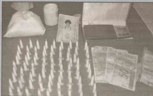
Foram apreendidas porções de coca, balança e embalagens

Os policiais Beto Lima e Da Luz foram ao local, onde foram recebidos por