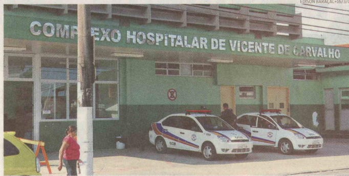
O hospital e maternidade foi fechado no final de fevereiro para a correção de falhas em sua estrutura

Disposta a resolver essa questão no menor tempo possível, ainda ontem a Prefeitura publicou vários editais de pregão